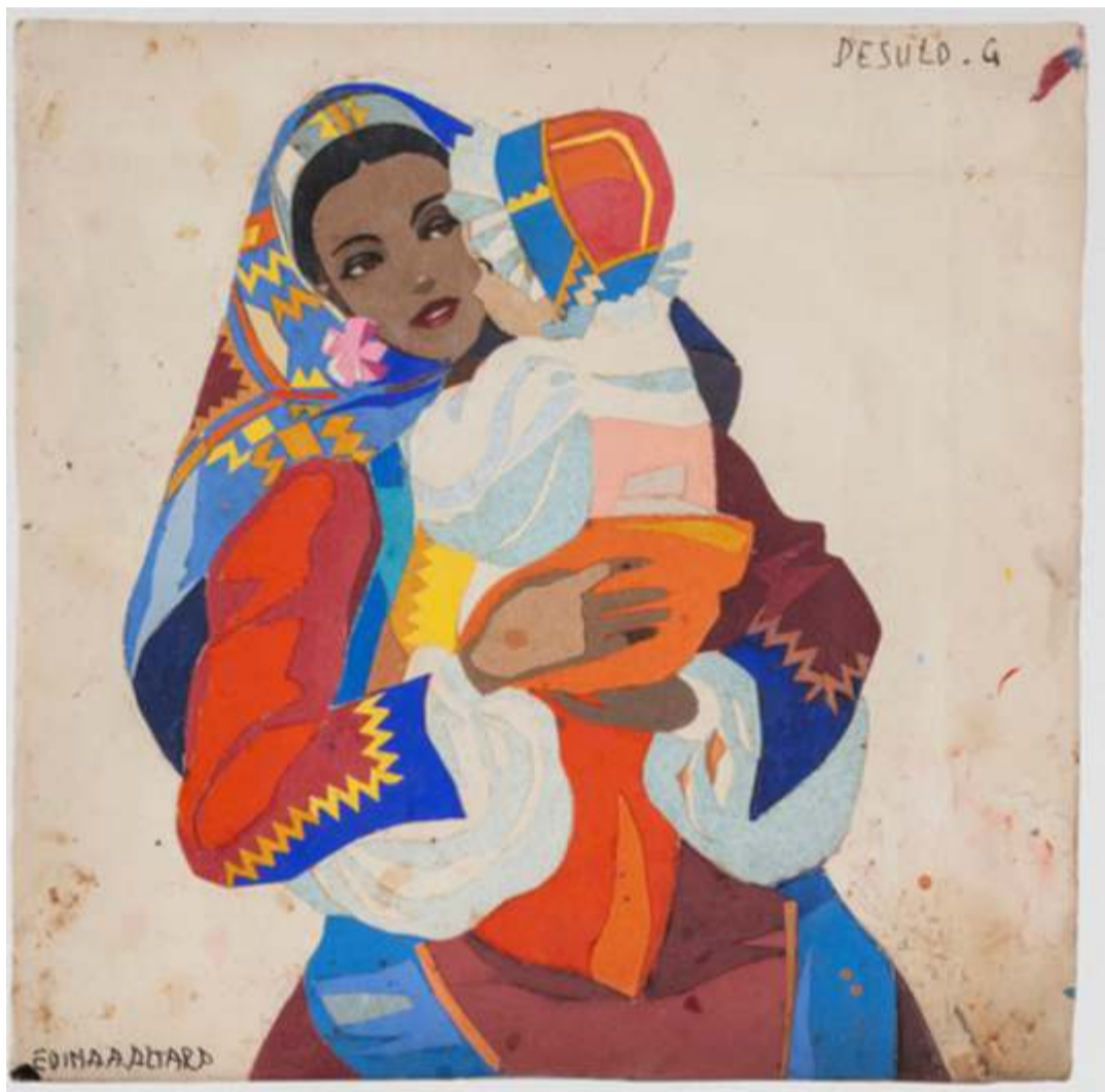
image courtesy: Edina Altara, Nuoro «Donna di Desulo con bambino» - tratto da sardegnadigitallibrary.it