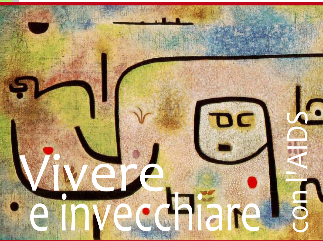
Paul Klee «metamorfosi fantastiche» 1938

Sabato 2 Dicembre 2023 Unahotels Thotel, Cagliari