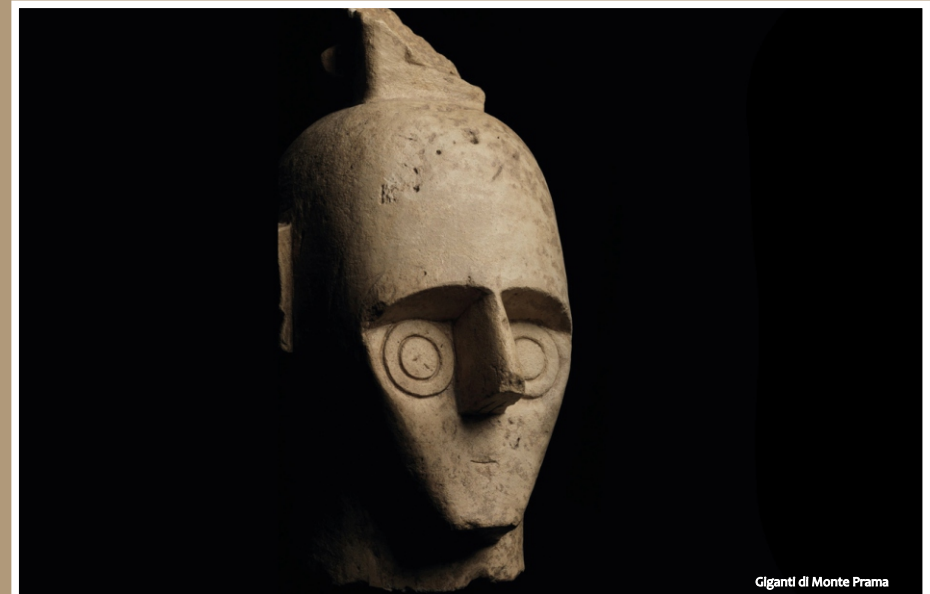
Giganti di Monte Prama

Sabato 21 Ottobre 2023 Hostel Rodia, Oristano